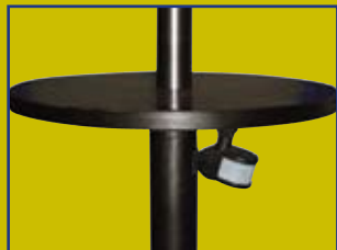
■ judesio daviklis

Šildytuvas pagamintas iš plieno ir nudažytas atmosferiniams poveikiams atspariais dažais. Turi du 1000 W VANDENIUI ATSPARIUS elektrinius spindulinius šildytuvus ir judesio daviklį, kuris užtikrina ekonomišką veikimą.