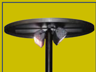
■ atsparus vandeniui